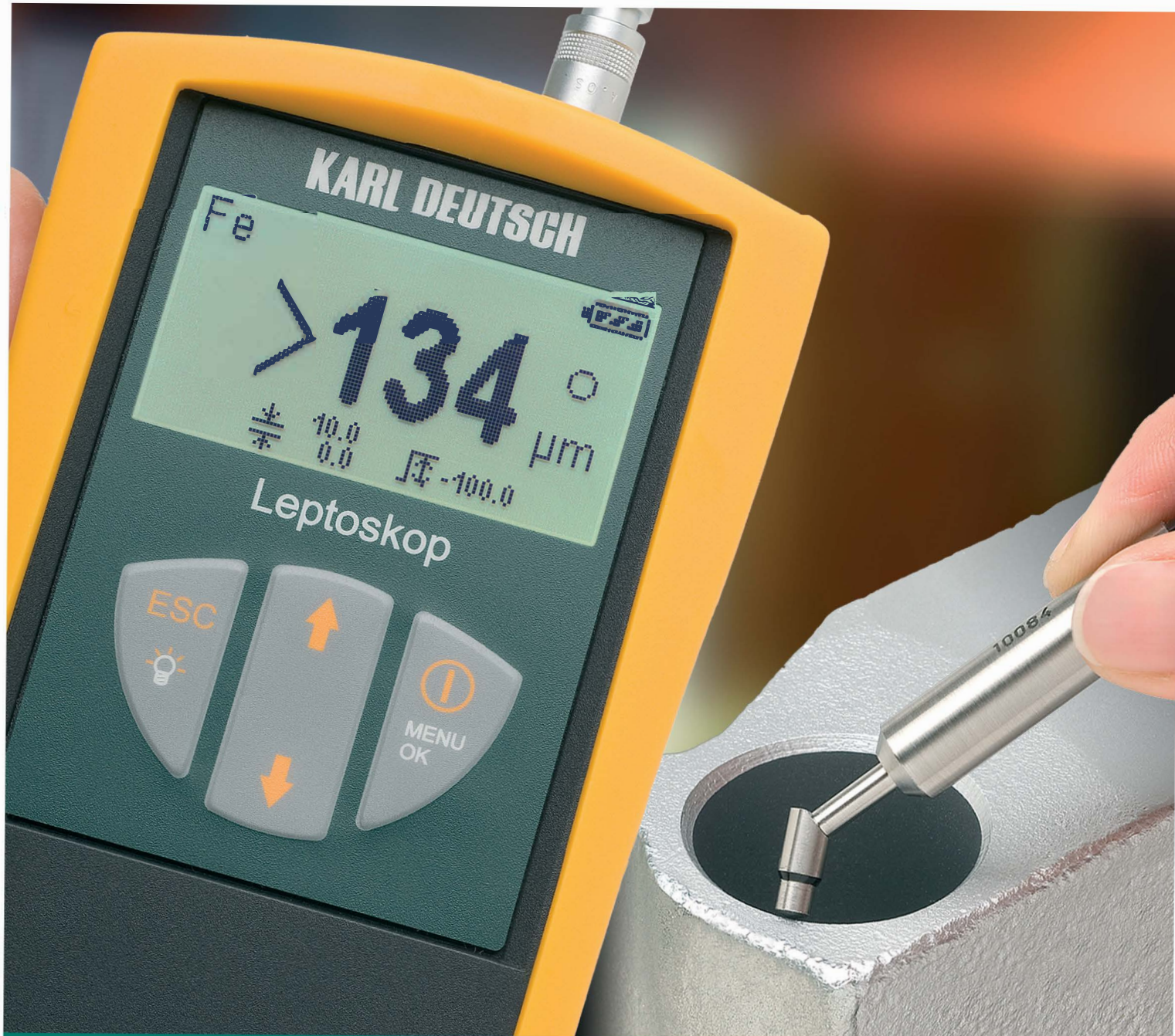
LEPTOSKOP® 2042 塗鍍層測厚儀