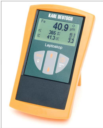
螢幕同時顯示測量數據和統計結果