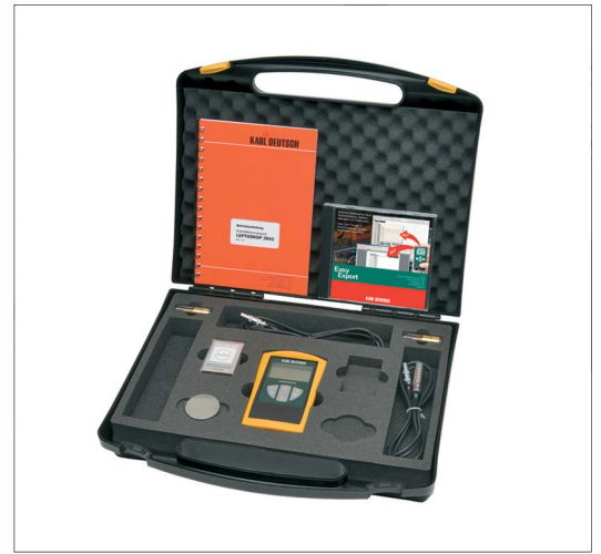
隨機附送防震手提儀器箱

KARL DEUTSCH Wuppertal Germany Phone (+49-202)7192-0 Fax 7149-32 info@karldeutsch.de www.karldeutsch.de